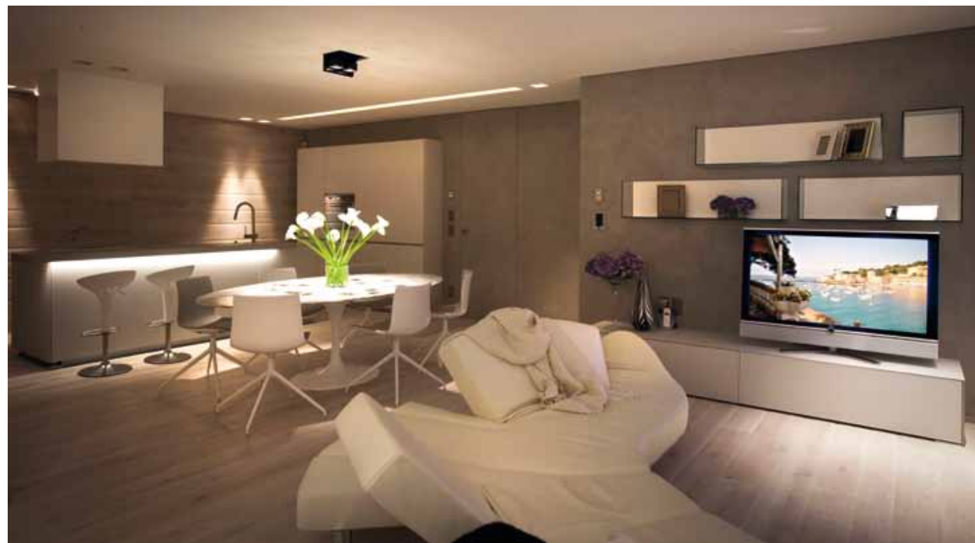
Divano in pelle bianca "Flap" di Edra; parete TV realizzata in vetro su disegno dell'architetto Pozzoli